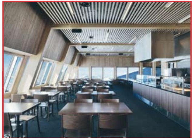
Im MINERGIE-P®-Restaurant auf dem Klein Matterhorn können sich die Besucher mit viel Komfort verpflegen.

Das Touristenzentrum «Matterhorn glacier paradise» auf dem Klein Matterhorn oberhalb von Zermatt liegt auf 3883 Meter über Meer und ist der höchste Aussichtspunkt Europas, der mit einer Luftseilbahn erreicht werden kann. Der Ort zieht mit seinem atemberaubenden Blick auf zahlreiche Viertausender Bergbegeisterte aus aller Welt an und ist ein beliebter Ausgangspunkt für Berg- und Skiausflüge. Mehr als eine halbe Million Menschen besuchen den Gipfel jährlich. Bis anhin erwarteten die Besucher einfache Verpflegungsmöglichkeiten und rudimentäre sanitäre Installationen. Seit Dezember 2008 bietet die Zermatt Bergbahnen AG ihren Gästen eine zeitgemässe und attraktive Infrastruktur: Sie können nun im neuen Restaurant einkehren oder in der Bergsteigerunterkunft übernachten. Für die Bauherrschaft war – gerade an dieser Lage – die Umweltverträglichkeit und die Energieeffizienz des Projektes von grosser Bedeutung: Aus diesem Grund erhielt das Touristenzentrum das MINERGIE-P®-Zertifikat und ist somit das höchstgelegene Gebäude mit dieser Auszeichnung.