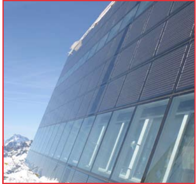
Die in die Südfassade integrierten Photovoltaikzellen liefern den Strom für die Lüftung und Heizung des Gebäudes.

In dieser hochalpinen Lage ist die Nutzung von Sonnenenergie ein Muss. Aus diesem Grund besteht die gesamte Südfassade aus integrierten Photovoltaikpaneelen. Aufgrund der konsequenten Ausrichtung nach Süden und der Neigung von rund 70 Grad erzielt die Anlage einen hohen Ertrag. Zudem sind Solaranlagen durch die klare Luft und die reflektierte Strahlung aus der Umgebung im hochalpinen Raum bis zu 80 Prozent ergiebiger als vergleichbare Anlagen im Mittelland. Die Photovoltaikanlage stellt die gesamte elektrische Energie für die Wärmeerzeugung und die Lüfterneuerung bereit. Ein allfälliger Überschuss wird ins Stromnetz der Zermatt Bergbahnen AG eingespeist und bei Bedarf wieder bezogen. Gleichzeitig funktioniert die Fassade wie ein thermischer Luftkollektor: Kalte Aussenluft wird hinter den Photovoltaikzellen erwärmt und dann zur Vorwärmung der Zuluft für das Restaurant und die Zimmer verwendet – das reduziert den Heizenergiebedarf. Zudem entsteht ein Kühleffekt, der den Wirkungsgrad der Solarzellen steigert.